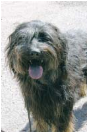
SPECIELI TUNGA Thrix, som är en katalansk vallhund, har en blåfläckig tunga.

Titte Törnroth-Sarkkinen titte.tornroth@nyan.ax